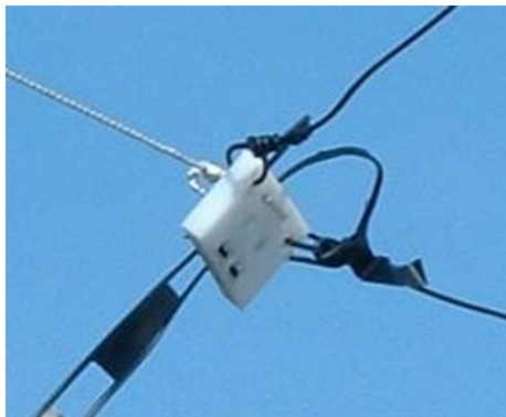
Tässä se paljon parjatun looppini syöttöpiste. Hankien kadottua tämä katoaa samalla.

Lopuksi vielä uutinen syrjäisestä OH2-piirin satamakaupungista, jossa Uudenmaankadulla rikkoutui pakkasten jälkeen suuri syöttölinja. Syötön rikkouduttua ha-